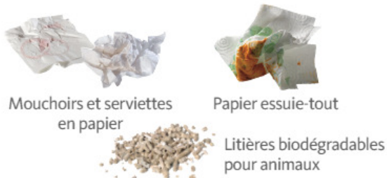
Mouchoirs et serviettes en papier